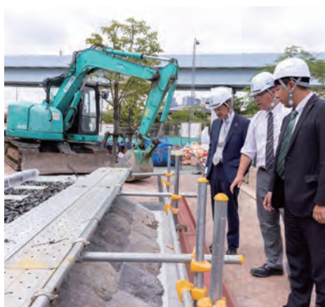
高輪築堤の石を利用した台座