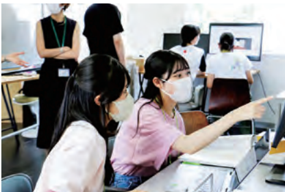
研究に対する積極的な姿勢が見受けられました

そイノベーションが生まれる」という考えのもと、学部女子学生比率を18.7%から、2027年の設立100周年には30%以上へ引き上げることが目標として、さまざまな取り組みを行うこととしています。 本プログラムでは、山脇学園高校および昭和女子大学附属昭和高校より計29人の生徒が、4系統（機械・ロボット、情報・プログラム、材料・化学、建設・環境）から成る15の研究室に配属され、インターンシップに取り組みました。 担当教員や大学生、大学院生と一緒に「系統別発表会」に向けて、各々が各研究室で与えられたテーマに沿って、実際に研究活動を行い、参加者からは「研究室に自分専用の