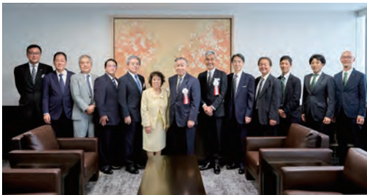
関係者全員集合写真