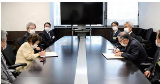
協定締結式の様子