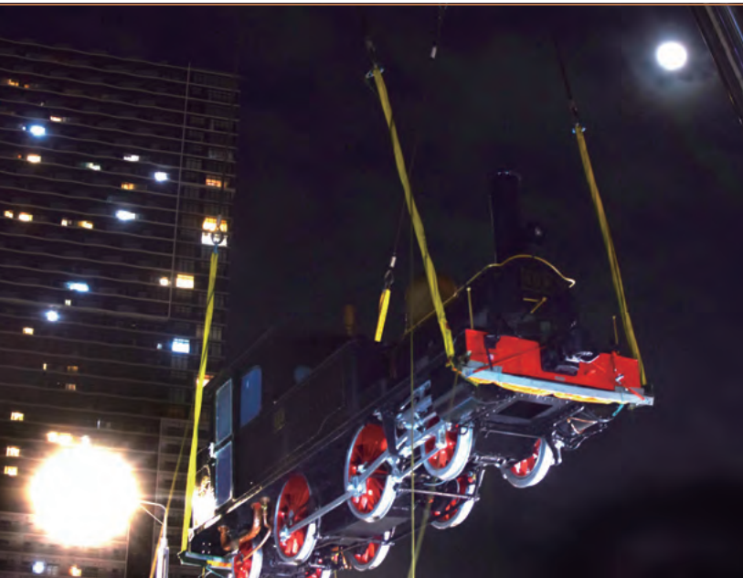
新豊洲に設置するためクレーンで吊るされたSL

並木…実は今回の施工でいちばん苦労したのは、車両を設置する基礎の石積みです。1872年に日本初の鉄道が敷設された際、海上を走るために高輪築堤が築かれ、その遺構が2019年に発掘されました。縁あってその築堤の石をいただけることになり、SLの台座として再利用することになったので、歴史的重みをどこまで表現できるか、協力会社とかなり検討を行って施