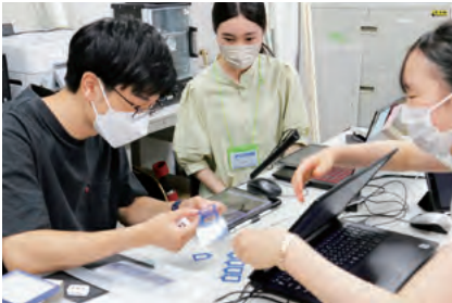
TA（ティーチングアシスタント）と実験に取り組む姿

芝浦工業大学は、「未来を担う理工系女性技術者の育成」の一環として、女子高校生対象サマー・インターンシップを7月28日から8月5日にかけて開催しました。 日本における工学系学科の女子学生比率は15.6%（文部科学省学校基本調査令和2年度）と、世界と比較しても低水準です。「教育も研究も、ダイバーシティの中でこ