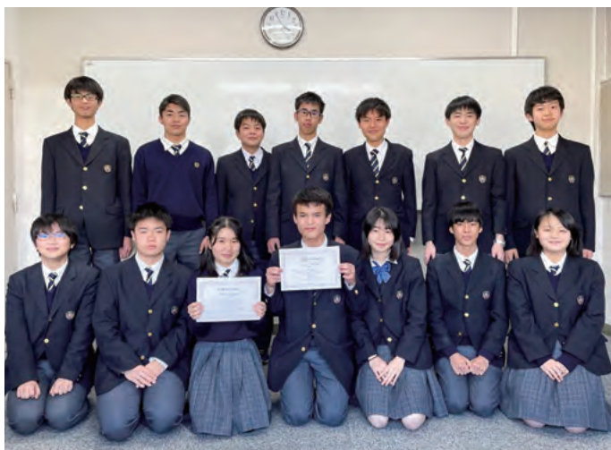
表彰状とチームの集合写真

3月26日、第11回日本高校生パラメンタリーディベート連盟杯（全国大会）に、芝浦工業大学柏高等学校の生徒3人が初出場しました。パラメンタリーディベートとは、ひとつの論題に対して肯定チームと否定チームに分かれ、各々