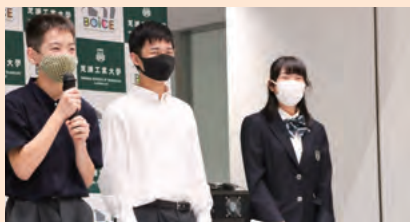
表彰コメントの様子

こもったビジネスプランを学内外から広く募りました。最終審査会には、応募総数43チーム(ビジネスモデル部門26チーム、アイデア部門17チーム)の中から、書類選考を通過した8チームが出場しました。 審査会では、大学院生や学部生、そして中高生の各チームが、15分の持ち時間の中で力強くプレゼンテーションを行いました。各々の事業企画を審査員に理解してもらい、事業パートナーと認めてもらうために、事業のCM制作や商品のモックを準備するチームも見られました。審査員からも厳しい質問や賞賛のコメントが飛び交い、会は大いに盛り上がりました。