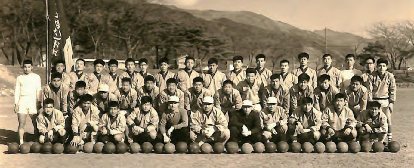
1959年度春季合宿集合写真

「だから迎えに行つてくれ」と連絡が入りました。探してみると確かに山口に帰っていて、彼を東京まで送っていったことを覚えています。