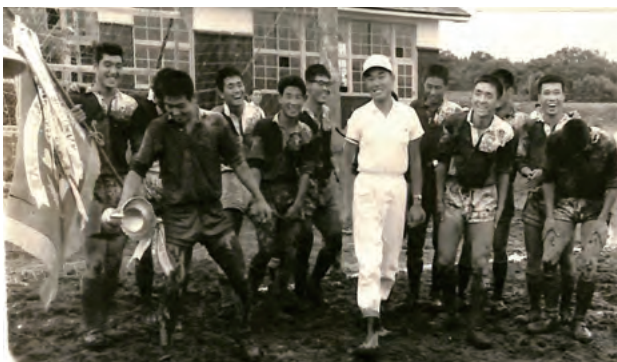
1960年8月全日本総合ハンドボール選手権大会にて公式大会46連勝