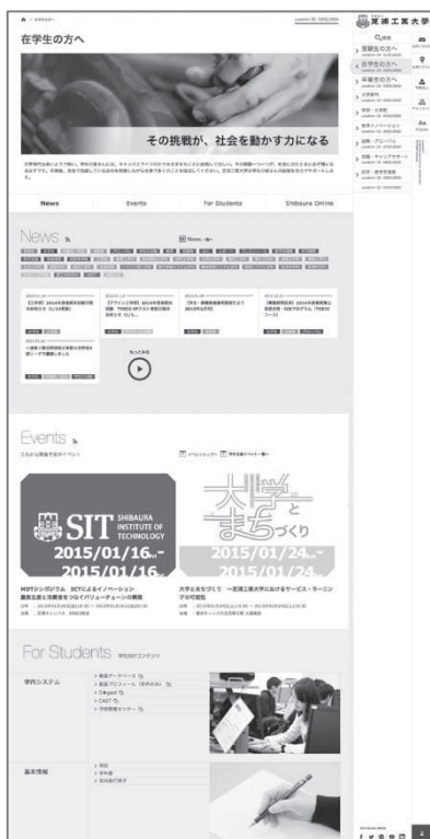
在学生向けページ (PC 表示)

時間割、シラバス、学年歴（年間スケジュール）もこちらから確認することができます。