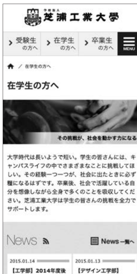
在学生向けページ (スマートフォン表示)