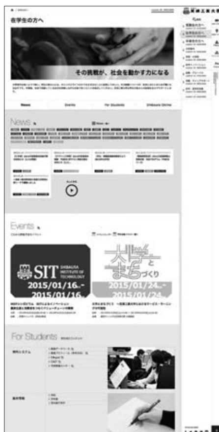
在学生向けページ (PC 表示)