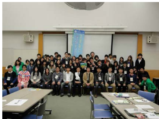
全国環境活動コンテスト