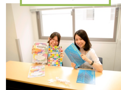
企画広報課と協力しての取材!