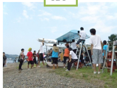
琵琶湖にすべてを捧げる!