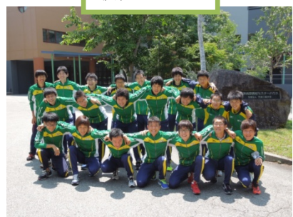
芝浦史上初の箱根予選会出場!