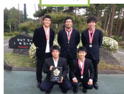
関東大会準優勝の実力!