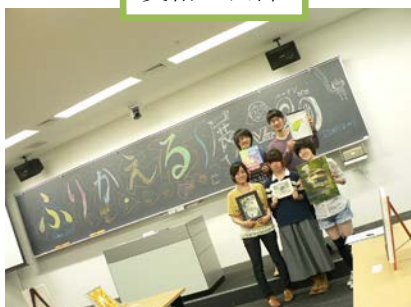
17 大学をまとめ、展示会を開催