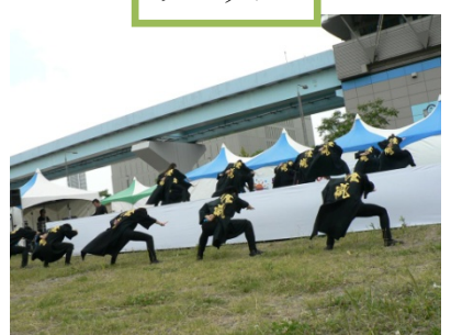
多くの舞台でソーラン節を披露!