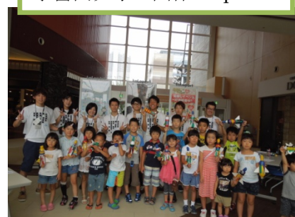
模擬衛星「缶サット」+地域交流