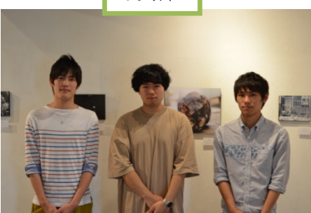
個展に向けて写真の技を磨く!