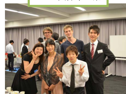
学生間の国際交流を先導!