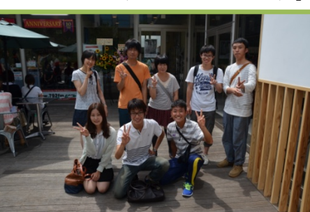
芝通+駅伝+FM 芝屋とのコラボ!