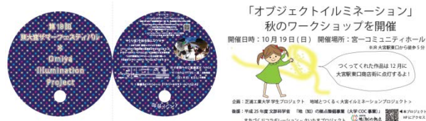
Pict9.うちわ型フライヤー及び名刺