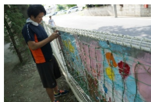
Pict3 蓮沼小学校イルミネーション設置