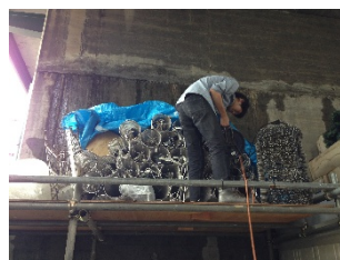
Pict1 大宮・資材置き場の整理