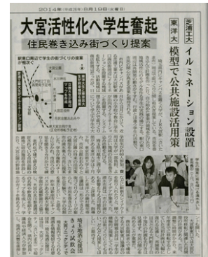
Pict10.日本経済新聞 埼玉版 2014.08.19 朝刊の記事

2014年8月19日(火)の日本経済新聞埼玉版に、本プロジェクトが取り上げられました。さいたま市で地域に向けて活動する大学生を対象にした特集記事であり、本プロジェクトをより多くの人に知って頂く機会となりました。