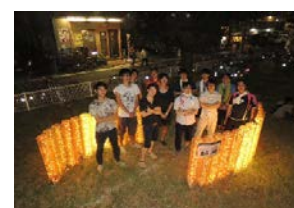
Pict4 東大宮サマーフェスティバルのメンバー集合写真