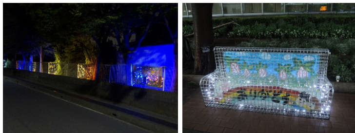
Pict7.お絵かきメッシュ(左)と椅子型フェンス(右)のイルミネーション点灯写真

学生プロジェクト「FACE TO FENCE」と共同で、蓮沼小学校のフェンスに「お絵かきフェンスイベント」で子ども達が描いた絵と一緒にイルミネーションを設置しました。昼と夜に見せる顔が異なるお絵かきメッシュは、夜道を明るく照らし、まちの安心安全にも繋がる活動となり、地域住民の方や通行人に街に灯る光を楽しんでもらうきっかけとなりました。(Pict7)