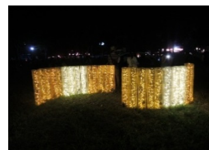
Pict5 東大宮サマーフェスティバルのイルミネーション点灯