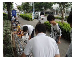
Pict2 見沼区役所前椅子型フェンス設置