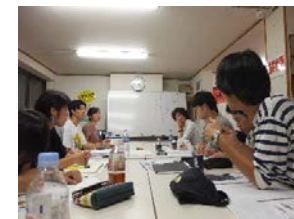
Pict6 第一回宮一サミット栗原理事長との会議