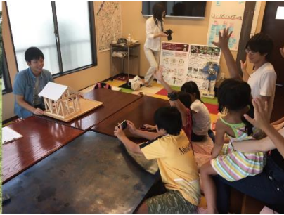
写真2: 宿題 DAY (夏)