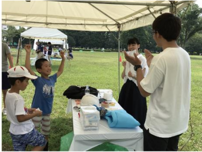
写真1: わんぱく防災フェスタ

そして9月にANAが運営するクラウドファンディング Wonderfly にて、114 作品中の8 作品に選ばれ、PRIZE WINNER 賞を受賞しました。今後、プロトタイプ作製に進み、サポートを募りながら事業化・製品化を目指します。