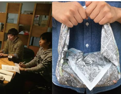
写真9: 防災ふるしき