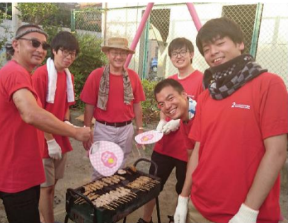
写真6: 東向島二丁目町会盆踊り