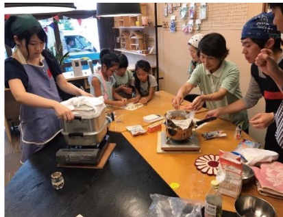
写真7: ふじのき企画