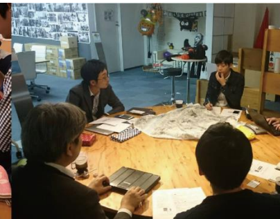
写真8: ものづくり打ち合わせ