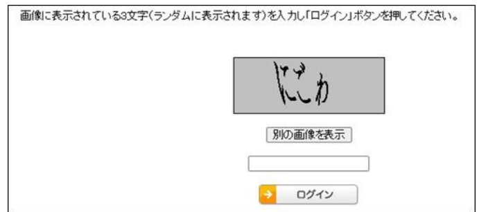
図 1：ログインのセキュリティの工夫

NE 比はパターン 1 全体で 5.7、パターン 2 全体で 9.2 と比較的高く、初心者にわかりづらく、改善が必要という結果となりました。パターン 1・2 の確認事項ごとの数値では、確認事項 1 はそれぞれ他の確認事項より NE 比が低いことが判明しました (表 2 赤枠)。パターン 1・2 の確認事項 1 には、マイページのログインが含まれていましたが、文字の読み間違いが多く、セキュリティを高めるための工夫が、かえってログイン阻害につながる要因となっていました。(図 1)。