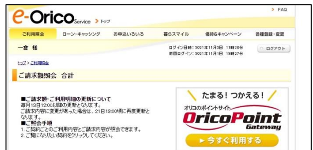
調査に使用した画面の一部