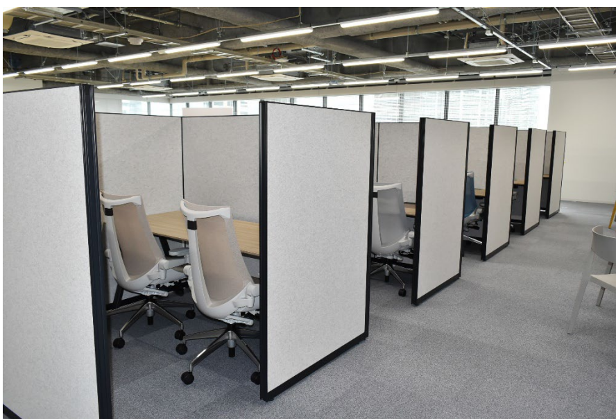
図 4. シェアオフィス