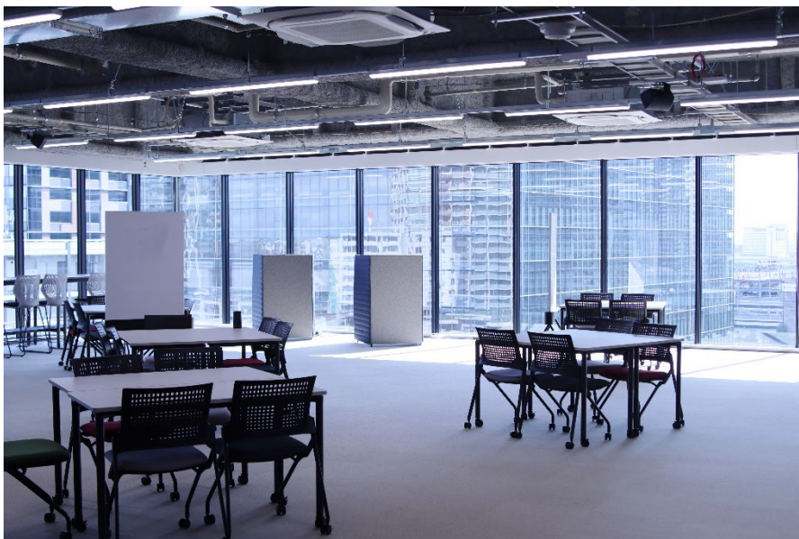
図 3. コワーキングスペース