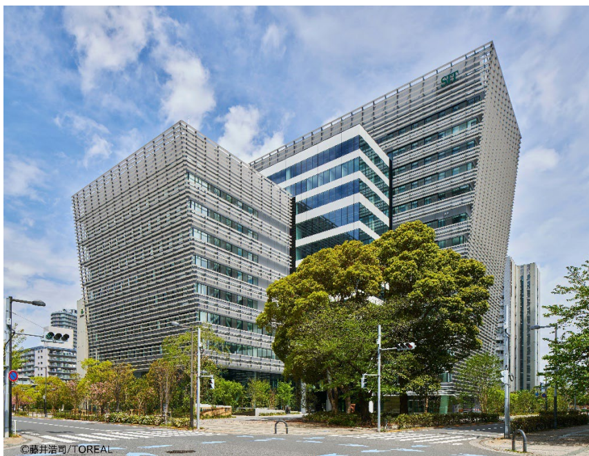
図 5. 豊洲キャンパス本部棟（BOICE を 10 階に開設）