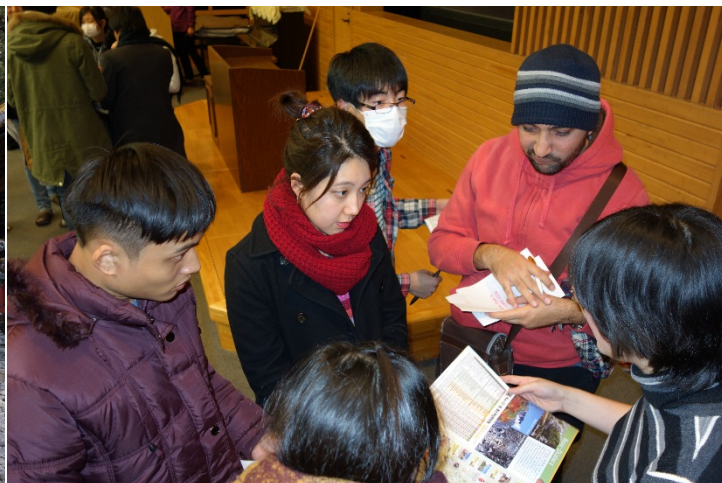
昨年のグローバルPBL 日光東照宮フィールドトリップ・那須町フィールドワークの様子