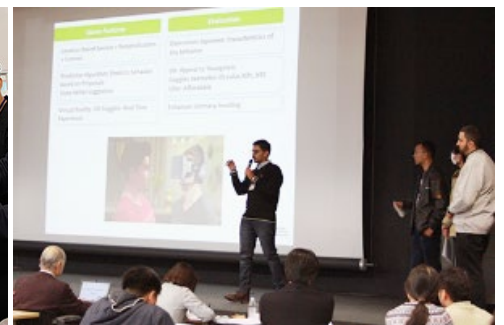
昨年のグローバルPBLの様子