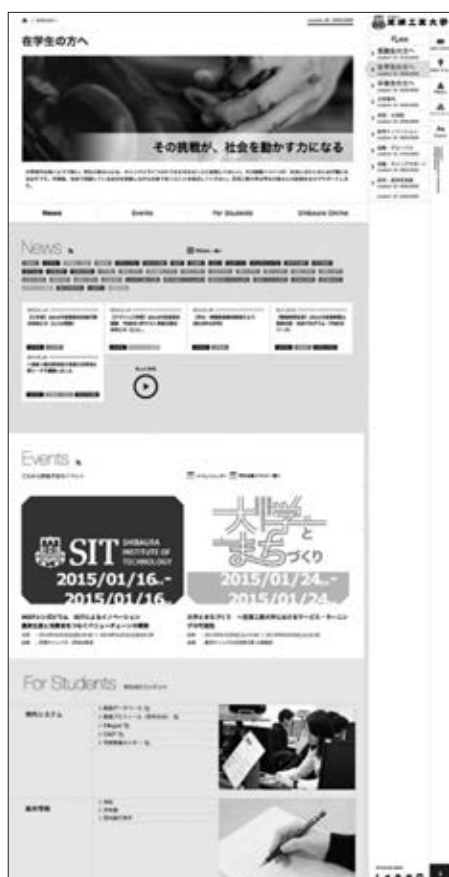
在学生向けページ (PC 表示)