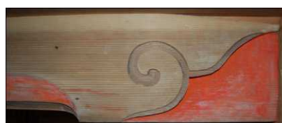
弘法堂厨子正面虹梁