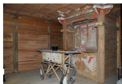
蓮華峰寺弘法堂 内部空間

右下図は、蓮華峰寺弘法堂の実測により得た図面データである。下図は、拓本を採取することで装飾絵様の比較を行う。蓮華峰寺境内の数棟の調査から得られた結果より、体系的な調査結果を今後示していく必要がある。