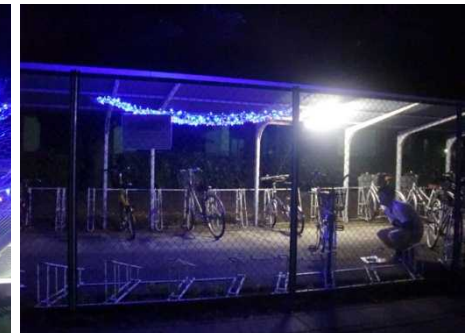
遠景での見えの検討

【現地にて、実際に設置することで、「天の川」の光量や通行者の安全性の検討を行いました。】