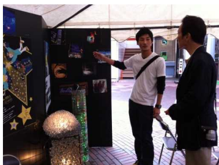
市の役員の方と意見を交わしました。

建築学会埼玉支所が主催する埼玉住まい・まちづくり交流展に参加致しました。今年度は志木ニュータウンペ あもーる商店街内の特設会場で「大宮駅東口商店街イルミネーション化計画」の展示や発表を行いました。市民の方や埼玉市の役員の方と直接お話し出来る機会が多くあり、まちづくりに対する考え方や「イルミネーション」による効果など積極的に意見を交わすことが出来ました。