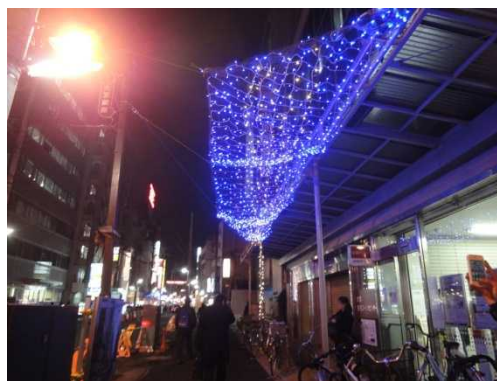
浮かぶようなイルミネーションが出来ました