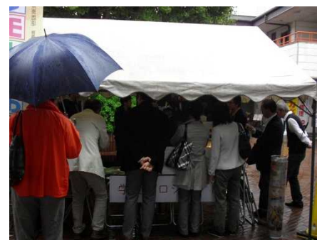
多くの方が興味を持って下さいました。