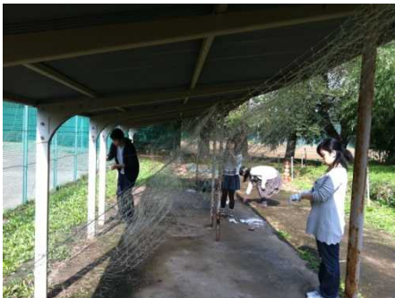
ネットの大きさの検討。

【大宮キャンパスにて、「天の川」の試作品を作成し、工法などの検討を行いました。】