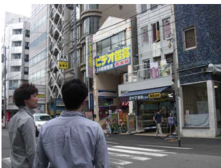
商店街の方と候補地を検討

●11月～12月:現地調査・「天の川」の作成 【イルミネーションの設置個所を把握するために、現地に足を運び調査致しました。】