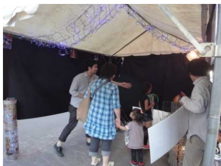
実際に体験していただきました。

大宮駅東口商店街の方が主催する、「大宮フリーマーケット」に参加致しました。今年度のテーマである「天の川」をイメージした試作品をテント内に展示し、訪れた方に体験して頂きました。そこで、地域の方々の希望するイルミネーションやイルミネーションで街をこう変えてほしいなど、多くの意見を聞くことが出来ました。