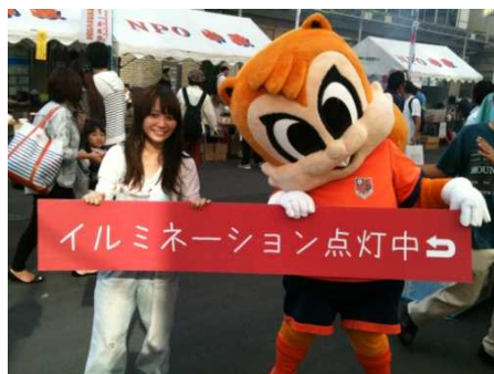
アルディー君も応援に来てくれました。