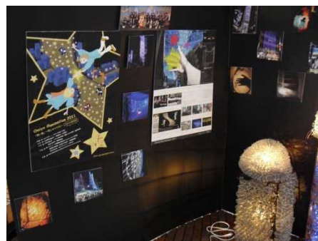
テント内の様子です。