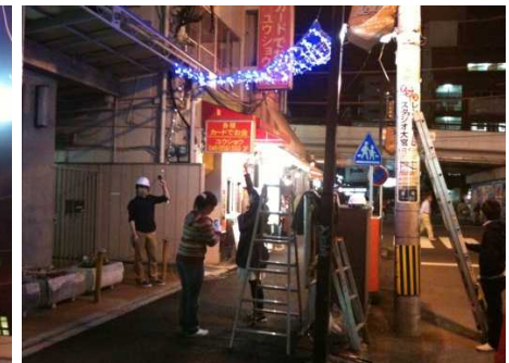
傘をさしても届かない位置に設置