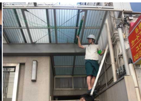
設置個所の安全性を考慮

【大宮キャンパスにて、「天の川」の試作品を作成し、工法などの検討を行いました。】