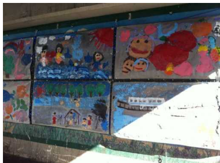
LEDのついた子供たちの絵を大栄橋の下に