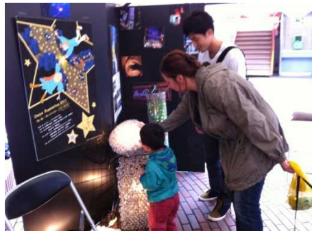
イルミネーションを楽しんでくれました。