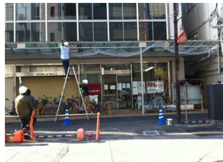
通行人の方の安全に配慮しながらの作業