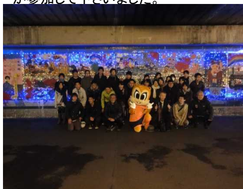
参加者全員で集合写真を撮りました

点灯式には衣袋先生、作山先生はじめ、大宮市長や大宮アルディージャの方々、商店街の方々など多くの方が参加して下さいました。