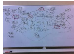
6月から9月までの間に行われた通常の会議の様子