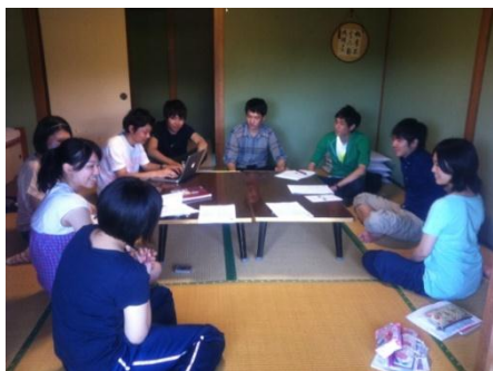
関東関西合同会議合宿(山中湖)