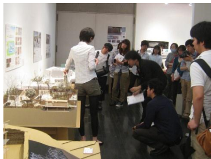
「卒、11」リベンジ展示会の様子(関西展)