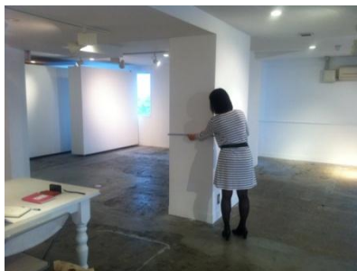
関東会場見学の様子