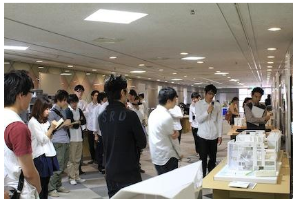
「卒、11」リベンジ展示会の様子(関東展)