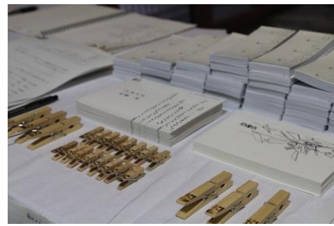
リベンジ会場にて「卒、12」 メンバー募集フライヤーの設置