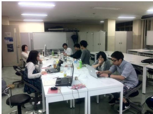
「卒、11」のサポート会議の様子