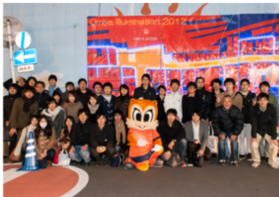
参加者全員で集合写真を撮りました。