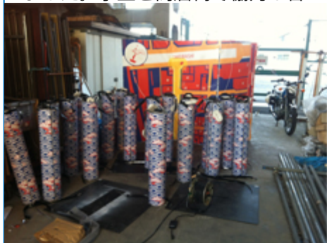
『街灯イルミネーション』の制作風景

また、製作を経て、現場にて設置作業を行いました11月30日の点灯式を目標に、およそ2週間朝から夜まで作業を行いました。学生と商店街で協力し合いながら完成を目指しました。