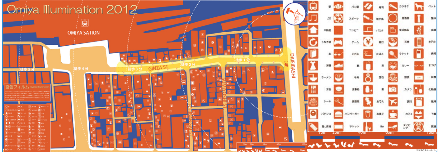
大栄橋イルミネーションのデザイン

大栄橋には、大宮・宮一商店街のMAPイルミネーションを計画しました。各商店をアイコン化し、デザインしたスケールバーやオリエンテーションをMAP上に配置します。バックライトフィルムに印刷したMAPを効果的に光らせる為にLEDの配置・点灯パターン等も検討しました。