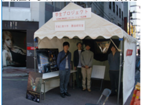
大宮フリーマーケットに出品しました。

多くの方々に本活動を知って頂くために、大宮フリーマーケットに出展し広報活動に励みました。ここでは今年度行うイルミネーションのスタディー品やインスタレーションを制作し、これまでの活動や今年の企画を積極的に紹介しました。さらに道行く人々から今年度のイルミネーションに対する貴重な意見をたくさんいただき、11月に実際に設置するイルミネーションに反映させました。