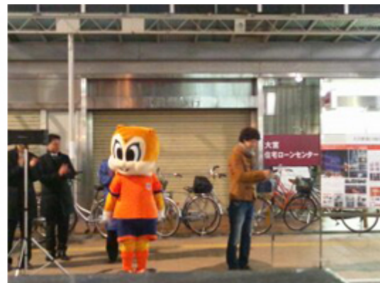
点灯式の様子です。アルディー君も喜んでます。