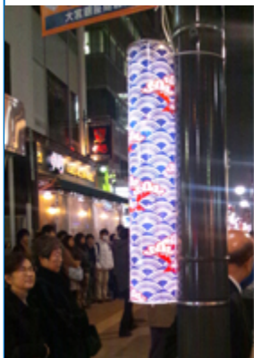
点灯したイルミネーション