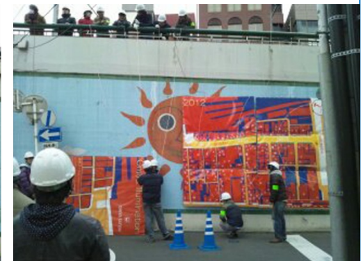
『街灯イルミネーション』『大栄橋イルミネーション』の設置風景。安全に注意し、設置作業を進めました