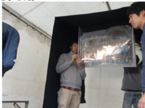
フィルムと光のインスタレーションです。