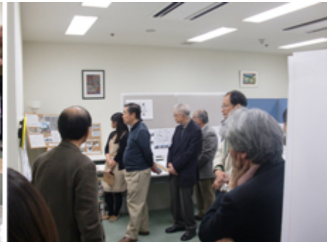
多くの専門家の方々から意見を頂きました。