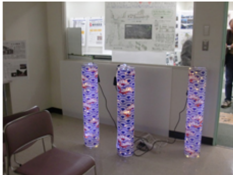
実際のイルミネーションを見て頂きました。