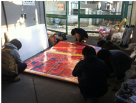
MAPをメッシュパネルへ取り付けます