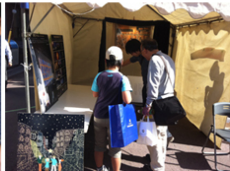
街の人から多くの意見を頂きました。