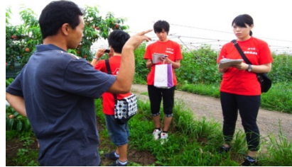
＜ヒアリングの様子＞