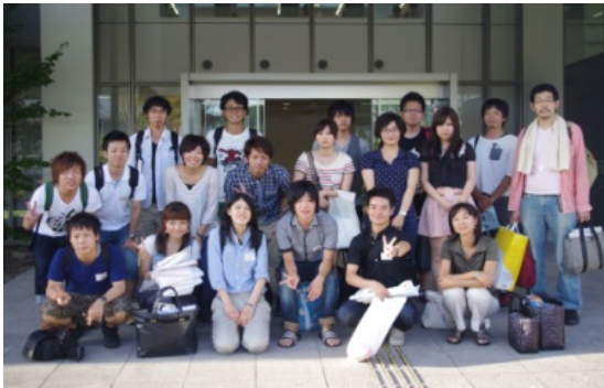
<参加者との集合写真>

参加させて頂くなかで分かったこととしては私たちの活動と類似している団体もあり、そのような方々と知り合うことで今後の活動の大きな手助けになると感じた。