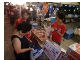
<桃とキュウリの販売>