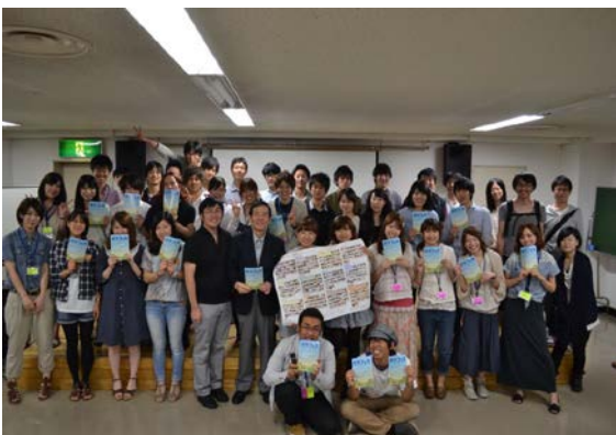
<左: 団体との集合写真>

課題としては、まったくこの活動を知らない人に自分たちの活動を広める際、申請会のようなプレゼンではなく、デザイン性の高いpptや、聞いている人に問いかけるような発表をすることが良いのではないかと知ることができたので改善していきたい。また、まだまだ交流にためらいが見られた部分もあったので、コミュニケーション能力の向上に尽力していきたい。