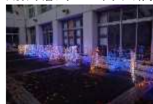
Pict3 春野小学校に設置した様子