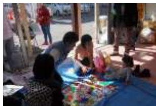
Pict1 大宮フリーマーケットの様子