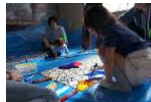
Pict7 大宮フリーマーケット ワークショップでの様子

12月には、一人一人がつくったイルミネーション作品を大宮の街に飾ることを伝えると、「ぜひ見にきたい」「とても楽しみである」との多くの声を頂いた。