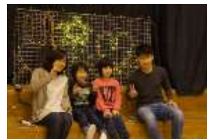
Pict8 「お絵かきイルミネーション」の様子

今年のイルミネーション活動のテーマとなる「フェスティバル(お祭り)」をもとに、小学生と一緒に一筆書きの絵をイルミネーションで描いて小学校に飾るイベントは、子供たちにも楽しんで参加してもらうことができ、保護者や小学校の先生方にも「また来年もやってほしい」との声を頂いた。ワークショップで制作したイルミネーションは、11月29日～12月19日春野小学校内に設置後、12月22日～12月26日見沼区役所にも展示した。