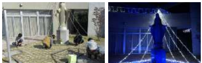
Pict10 大宮カトリック教会のイルミネーションの設置と点灯の様子

教会の方々にも好評頂き、来年度もやってほしいとの要請があった。大宮周辺でのイルミネーション活動が拡大し、地域の活性化を目標としてきた本プロジェクトによる活動の成果と手応えを感じることができた。