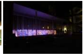
Pict6 見沼区役所イルミネーションの様子