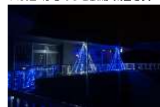
Pict4 教会イルミネーションの様子