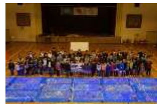
Pict2 はるのっ子広場 集合写真