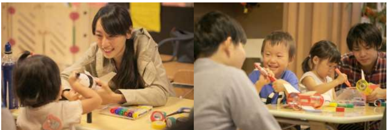
「メリーポピンズ」さんでの工作教室

アウトリーチ活動では、11月20日に豊洲にある保育所の「メリーポピンズ」さんからご依頼を頂きペットボトル工作教室をおこないました。子供たちの年齢がいつもの工作教室よりも低く、若干工程を変更しましたが、子供達にも楽しんでいただけたようでとても良い教室になりました。この場をお借りして、参加してくれた子供たち、ご依頼して頂いた、メリーポピンズ様、ご協力いただいた、社会福祉法人どろんこ会様、芝浦工業大学の学生課の方々には感謝致します。ありがとうございました。