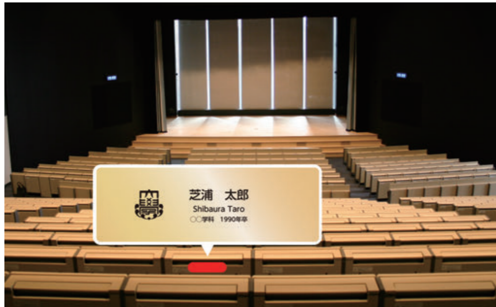
豊洲キャンパス大講義室の座席と座席芳名プレートのイメージ ※プレートデザインは変更の可能性があります。

ビジネスと暮らしが融合する産業創造の新拠点として注目のエリア「豊洲」に、2006年に誕生したのが豊洲キャンパスです。2022年に本部棟が竣工し、また、学生・教職員および地域の方の憩いの場となるシバウラキッズパーク、大階段のフラワーガーデンの整備が完了しました。その完成を記念して、大講義室の座席（前面）に、ご芳名プレートを設置し、末永く留めさせていただきます。寄付の用途は大講義室のスクリーン、プロジェクターといった施設・設備の整備に使われます。