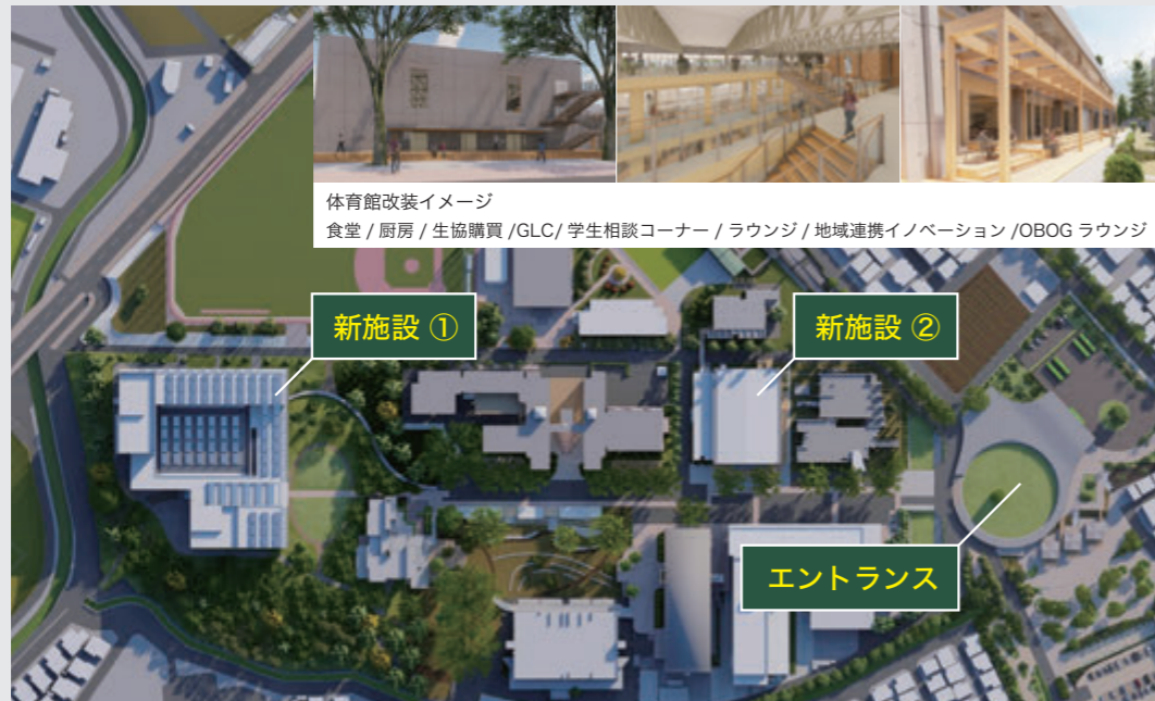
体育館改装イメージ

「カーボンニュートラル達成に貢献する大学等コアリション(文部科学省)」および「SIT SDGs宣言およびロードマップ」に取り組み、さいたま市をはじめとする産学官等の地域連携強化を図る活動を通して、教育研究機関の社会貢献を具現化する環境を創生します。