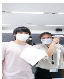
卵落としコンテスト