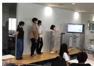
プレゼンテーション1