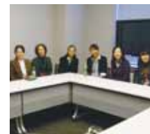
女性研究者交流会