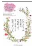
Shiba-joプラチナネットワークポスター