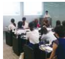
お茶の水女子大学・付属中高生と本学女子学生・女子中高生との合同セミナー