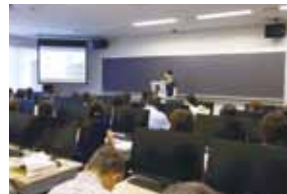
オープンキャンパス