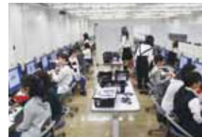
女子中高生向けセミナー