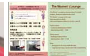
女性休憩室利用ポスター