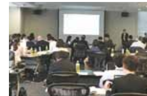
新任教職員研修会