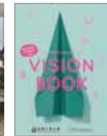
理工系をめざす女子中高生のための VISION BOOK