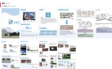
図6 最終プレゼンテーション1