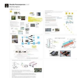
図7 最終プレゼンテーション2