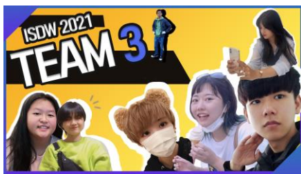
図2 ワークショップの活動風景

2008年から毎年開催されている「インターナショナル・サマー・デザイン・ワークショップ (ISDW)」。アジア太平洋地域の複数の国から集まった大学生たちが、共同でデザイン案を作成します。これを通じて、学生たちは「デザインスキル」「コミュニケーション能力」「異文化理解」を学びます。ISDWは、心を開いて、オープンマインドになることを目的としています。新しいアイデアにオープンな人々が集まり、共有やコラボレーションを行うことで、新たな視点を学び、お互いをよりよく理解することができ、最終的にはグローバルな友情とより、平和な世界へとつながるのです。今年は4カ国から5つの大学で52名の学生と6人の教員が参加しました。8月22日~29日まで8日間オンラインで毎日夜遅くまで活発な議論を行い素晴らしい成果物を提案ができました。