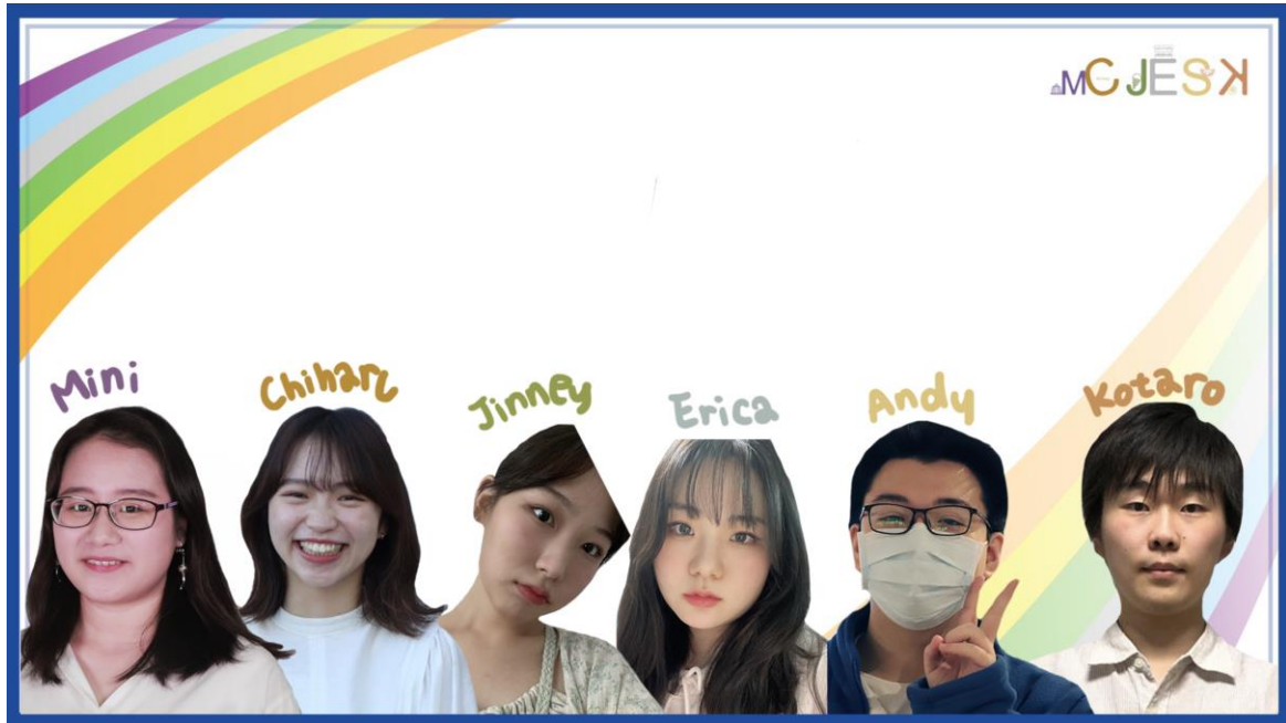
図1 最終発表の集合写真

2008年から毎年開催されている「インターナショナル・サマー・デザイン・ワークショップ (ISDW)」。アジア太平洋地域の複数の国から集まった大学生たちが、共同でデザイン案を作成します。これを通じて、学生たちは「デザインスキル」「コミュニケーション能力」「異文化理解」を学びます。ISDWは、心を開いて、オープンマインドになることを目的としています。新しいアイデアにオープンな人々が集まり、共有やコラボレーションを行うことで、新たな視点を学び、お互いをよりよく理解することができ、最終的にはグローバルな友情とより、平和な世界へとつながるのです。今年は4カ国から5つの大学で52名の学生と6人の教員が参加しました。8月22日~29日まで8日間オンラインで毎日夜遅くまで活発な議論を行い素晴らしい成果物を提案ができました。