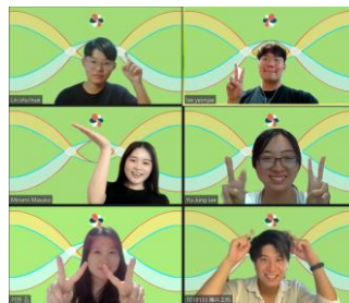
図3 グループの挨拶