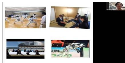
図4 芝浦工大の紹介