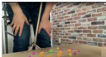
図2 メーキングビデオから2