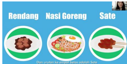
図7 インドネシアの食べ物クイズ