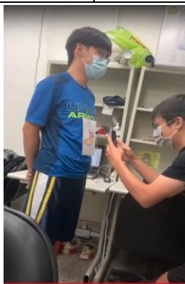
図1 メーキングビデオから

8-9月に予定されていたWMCU(スラバヤ)およびNTUST(台北)への派遣PBLが中止になった。2月に予定している受入PBLも開催の可能性は薄くなった。今まで構築された人的ネットワークを保持するために、往來がなくとも参加者が国を超えて共同作業できるようなプログラムが組めないかと考えた。その結果、2018年度の工業化学概論(応用化学科1年次)で採用した「身近な材料を使って化学反応のコマ撮リアニメ(オブジェを少しずつ動かしながら撮影し、撮った静止画を連続して映写することで動きを見せるアニメ)」を作らせるというプログラムを応用するに思い至った。以下のプログラムを実行した。