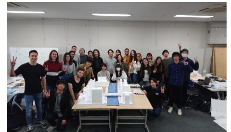
図4 発表会後の集合写真