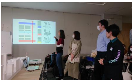
図2 最終発表会の発表風景

2月14日～19日の関西旅行後、ワークショップを開始し、毎週金曜日にプレゼンテーションを実施した。3月12日に最終発表会を実施した。コロナ感染の影響で最後は予定を変更せざるを得ず、急ぎイタリアに帰国したが、設計はよくまとめ上げた。