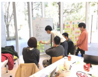
図2 附属高校の高校生も参加

毎年2月上旬に韓国の国民大学と日本からは芝浦工業大学、東京都市大学、千葉工業大学の学生が8日間AI(人工知能)+複数のキーワード(娯楽、教育、ファッション、移動、観戦など)を合わせたテーマで未来をAIによるビジョンを描く作業を行った。両国あわせて80人を超える学生たちが13グループに分かれて1週間以上活動しながらいいアイデアを生み出すために努力しました。とてもおもしろくて、実現可能なデザインがたくさんありました。1位～3位のグループは韓国デザイン学会と国際コンペにエントリーする予定です。