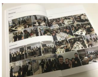
図5 ワークショップの成果物を制作