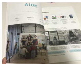
図6 ワークショップの成果物を制作