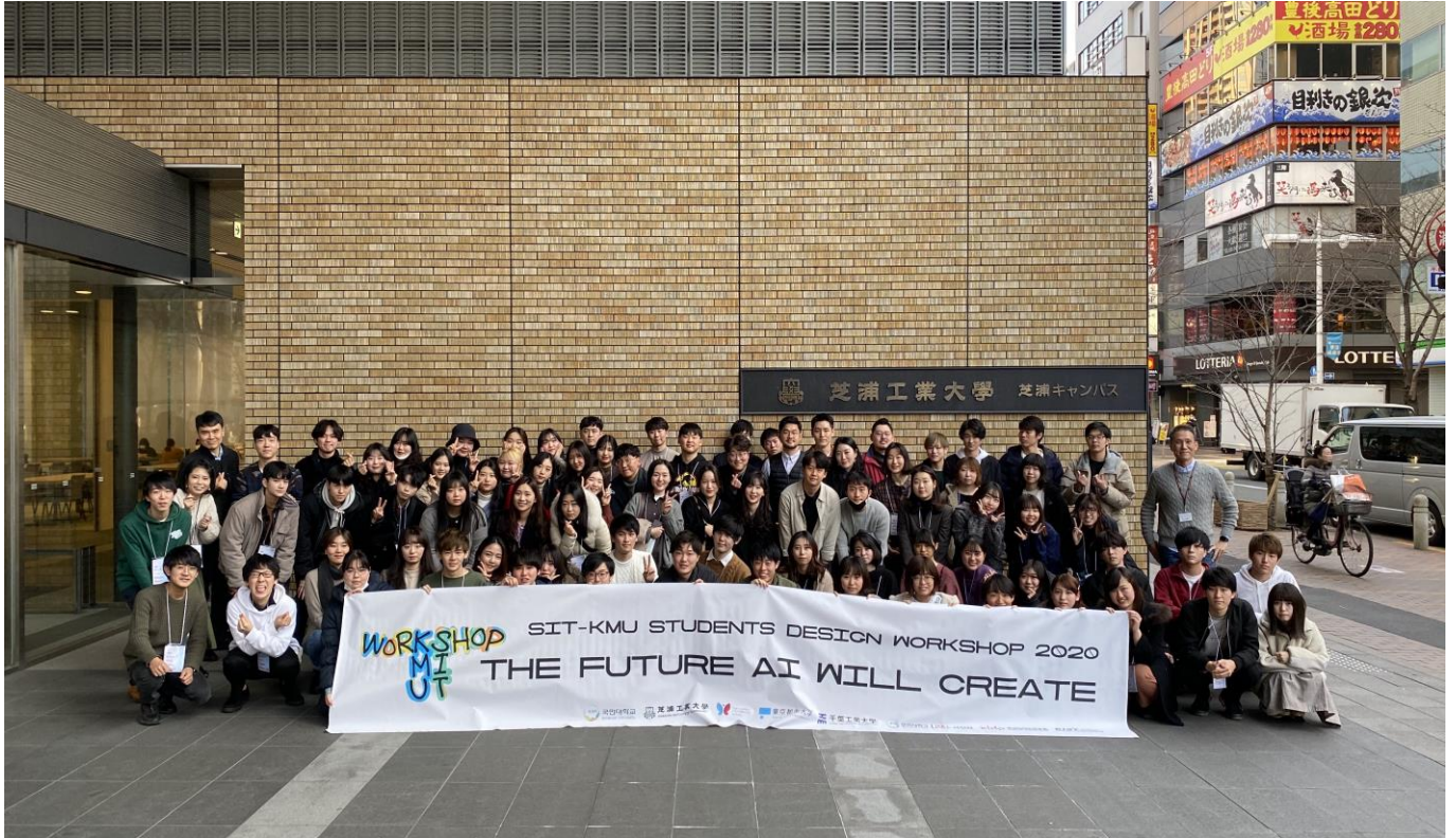
図1 参加者全員の集合写真

毎年2月上旬に韓国の国民大学と日本からは芝浦工業大学、東京都市大学、千葉工業大学の学生が8日間AI(人工知能)+複数のキーワード(娯楽、教育、ファッション、移動、観戦など)を合わせたテーマで未来をAIによるビジョンを描く作業を行った。両国あわせて80人を超える学生たちが13グループに分かれて1週間以上活動しながらいいアイデアを生み出すために努力しました。とてもおもしろくて、実現可能なデザインがたくさんありました。1位～3位のグループは韓国デザイン学会と国際コンペにエントリーする予定です。