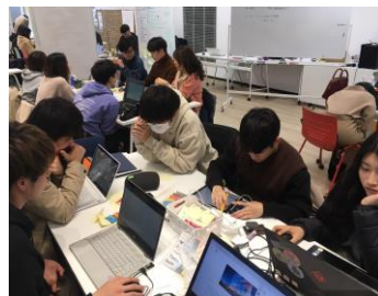
図3 もっと細かく、デザイン作業へ