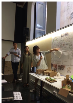
図3 最終講評会で計画案を発表